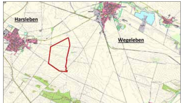
(Geltungsbereich des vorhabenbezogenen Bebauungsplan „Windpark Schmiedestein (West)“ in der Gemeinde Harsleben)

Der Geltungsbereich wird in dem nachfolgenden Kartenauszug abgebildet.