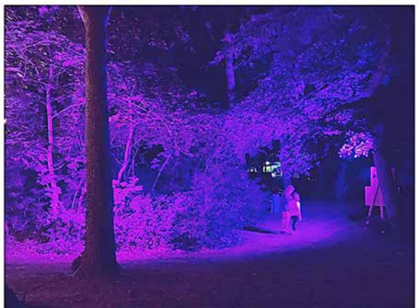
Lichtprobe am Vorabend