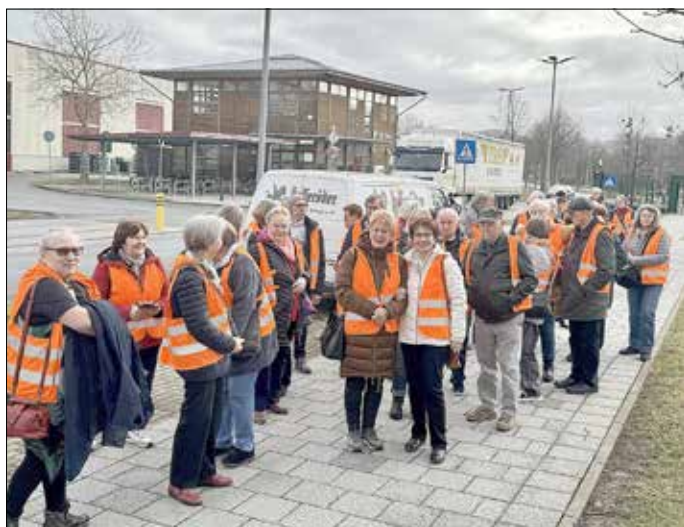
Einen erlebnisreichen Tag hatten die Senioren aus Harsleben im Harz, hier beim Besuch in der Hasseröder Brauerei.

Harsleben/dku. Eine Bierverkostung in einer Brauerei zur Mittagszeit kann schon recht lustig